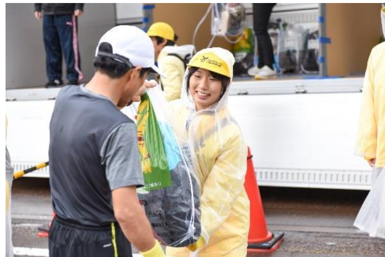
ボランティア登録者数(2019大会)