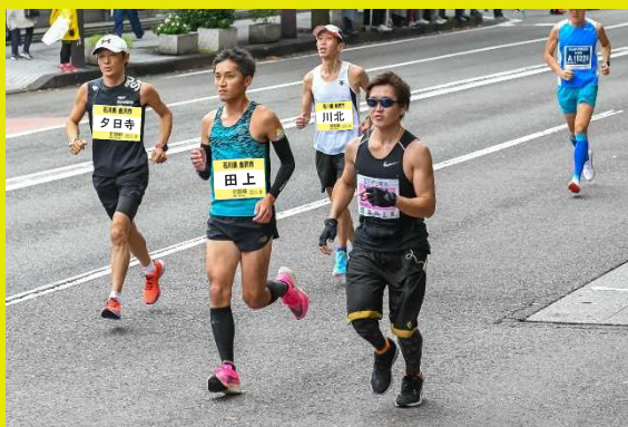
写真は地域ランナー枠の走行イメージ ※校下(地域)名入りナンバーカードを着用

※校下(地区)町会連合会ごとに地域ランナー枠の定員を設定しています。(裏面参照) 定員を超えた場合は、主催者が校下(地区)ごとに抽選を行います。