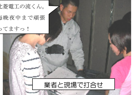
業者と現場で打合せ